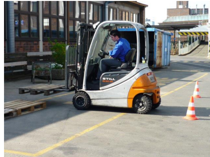
Abb.: Klaus Häpp