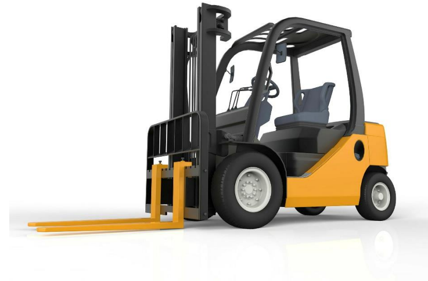
Abb.: © Nerthuz / Getty images / iStock